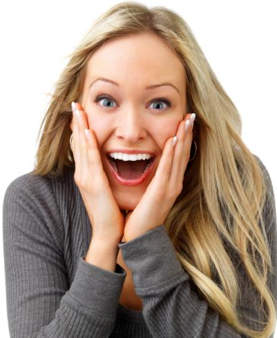
Power-Bleaching: Nicht zu fassen wie schnell die Zähne so hell werden