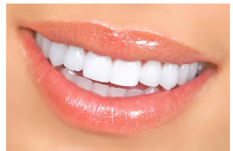
Power-Bleaching: Sichtbar hellere Zähne nach einer Stunde

Was kann man tun, wenn nur ein einzelner Zahn dunkel ist? Auf der nächsten Seite finden Sie Informationen zur Einzelzahn-Aufhellung!