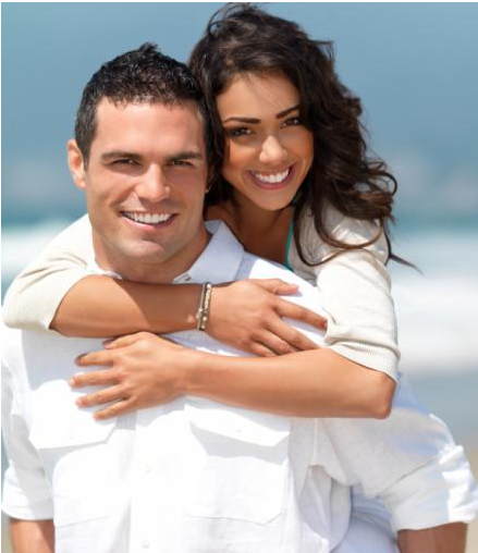
Home-Bleaching: Attraktivität und Ausstrahlung mit hellen Zähnen

Zahnaufhellung zu Hause mit Unterstützung durch den Zahnarzt