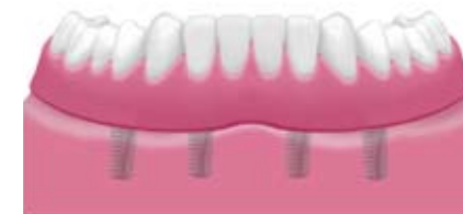
Implantatgetragene herausnehmbare Prothese