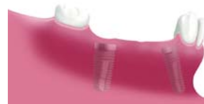
Zwei eingebaute Implantate