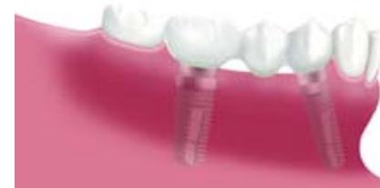
Dreigliedrige Brücke auf zwei Implantaten