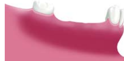
Situation nach Verlust mehrerer Zähne (Schaltlücke)