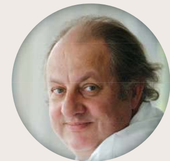
Vincent Klink Fernsehkoch, Autor, Musiker

Außerdem wird sichergestellt, dass die Gelder vor Ort in die richtigen Hände kommen – und das alles mit einer sehr schlanken Verwaltung.«